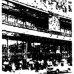
هنا كان المهرجان